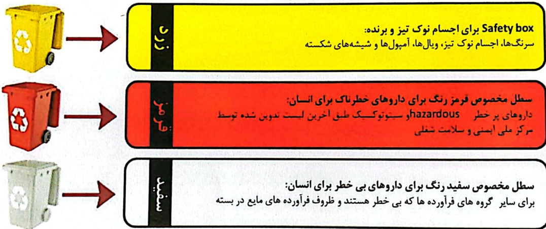
شکل ۱. سطل‌های مخصوص نگهداری موقت فرآورده‌های غیرقابل مصرف در داروخانه